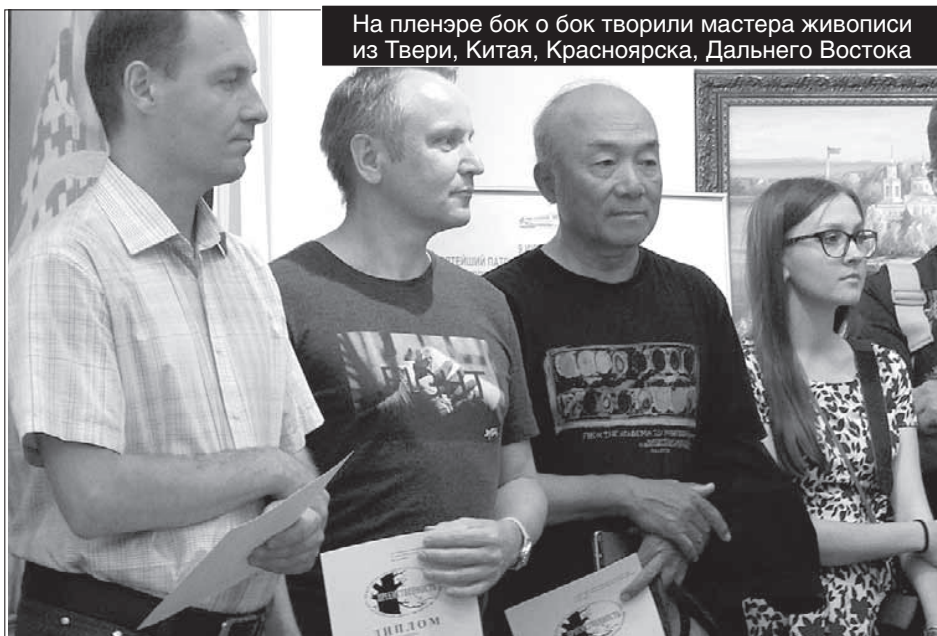
На пленэре бок о бок творили мастера живописи из Твери, Китая, Красноярска, Дальнего Востока

О РГАНИЗАТОРЫ пленэрно-выставочного проекта «Русская Атлантида» — Санкт-Петербургский центр гуманитар-