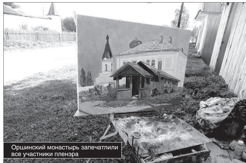
Оршинский монастырь запечатлили все участники пленэра

Во вторник Тверь покинула группа художников, проживавшая в Оршинском женском монастыре. Ее сменила группа, поселившаяся в Екатерининском монастыре, что в Затверечье. Затем будут Старица, Калязин, Осташков. Завершающая сезон выставка обычно проводится в одном из залов Санкт-Петербурга, где красоту и поэтику среднерусской природы и ее малых городов увидят жители культурной столицы России.