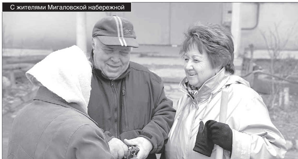
С жителями Мигаловской набережной

Словом, работа у меня очень разноплановая. Некоторые вещи могут показаться мелочью. Но я так не считаю. Раз пришел человек, то для него это важно. А власть должна слышать своих граждан и помогать им.