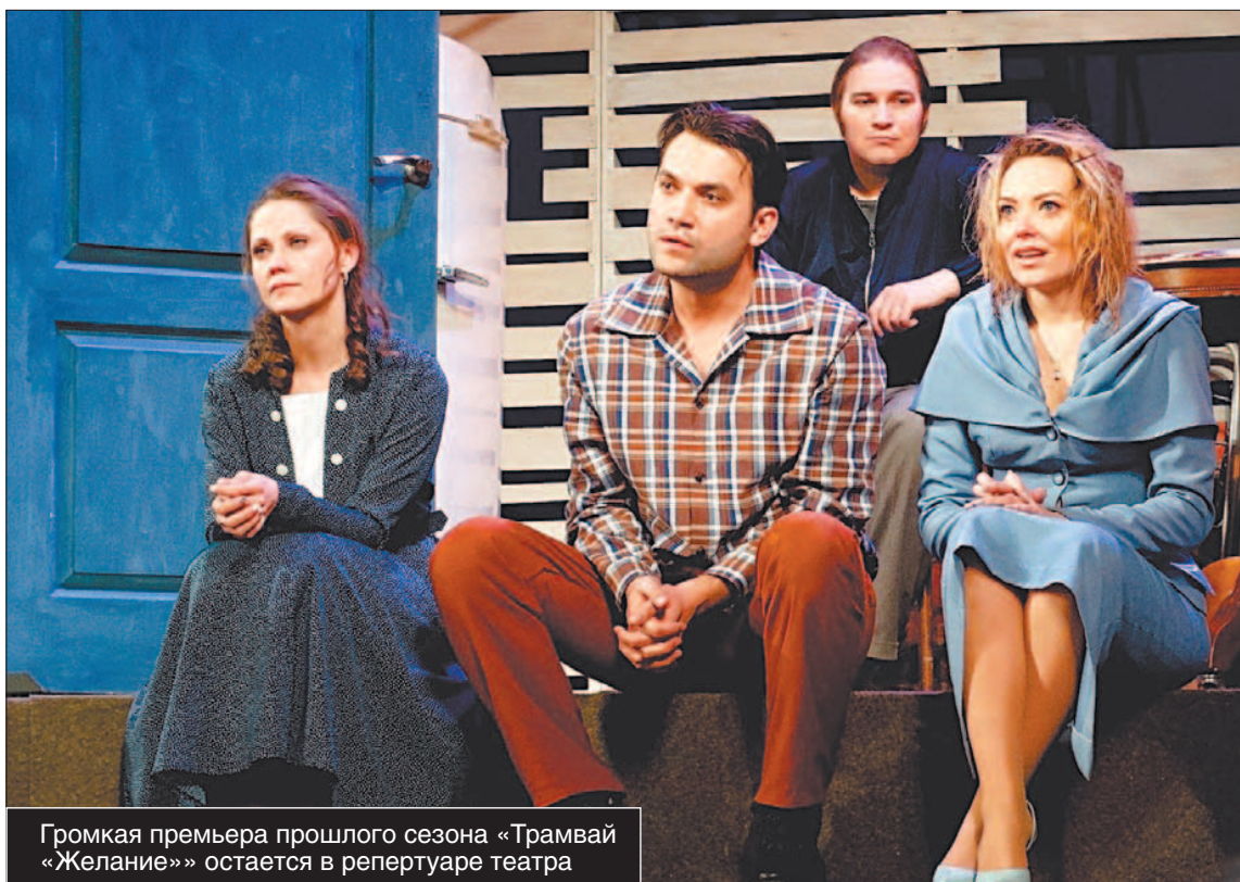
Громкая премьера прошлого сезона «Трамвай «Желание»» остается в репертуаре театра

Актеры и режиссеры уже приступили к репетициям. Во вторник в театре состоялся сбор труппы. Артисты, а особенно артистки, пришли в родной театр отдохнувшими, посвежевшими, веселыми, готовыми к творческому тру-