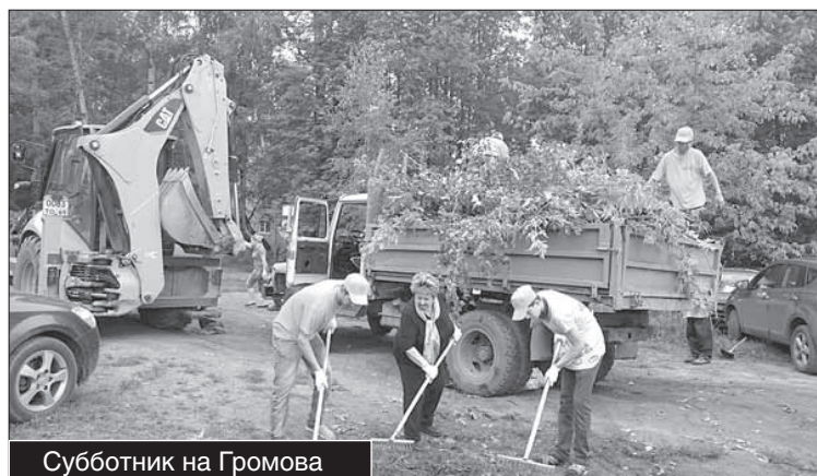
Субботник на Громова

По просьбе жителей оборудованы парковочные площадки у дома № 12 по Мигаловской набережной, пр-ту 50 лет Октября, д. 24.