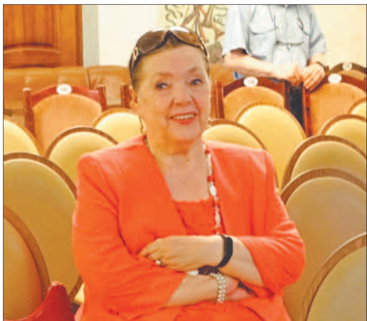
Народная артистка России Наина Хонина рада началу нового театрального сезона, 60-го в ее творческой жизни

272-й театральный сезон откроется очень скоро. Труппа Тверского академического театра драмы готовит зрителям премьеры и сюрпризы. Первый спектакль на большой сцене покажут 21 сентября.