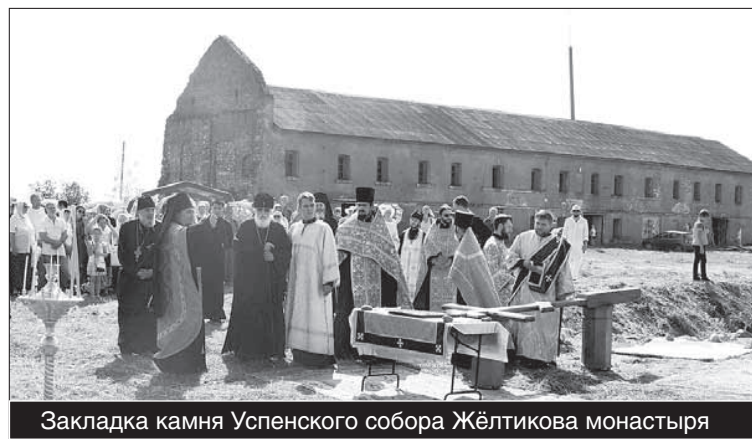
Закладка камня Успенского собора Жёлтикова монастыря