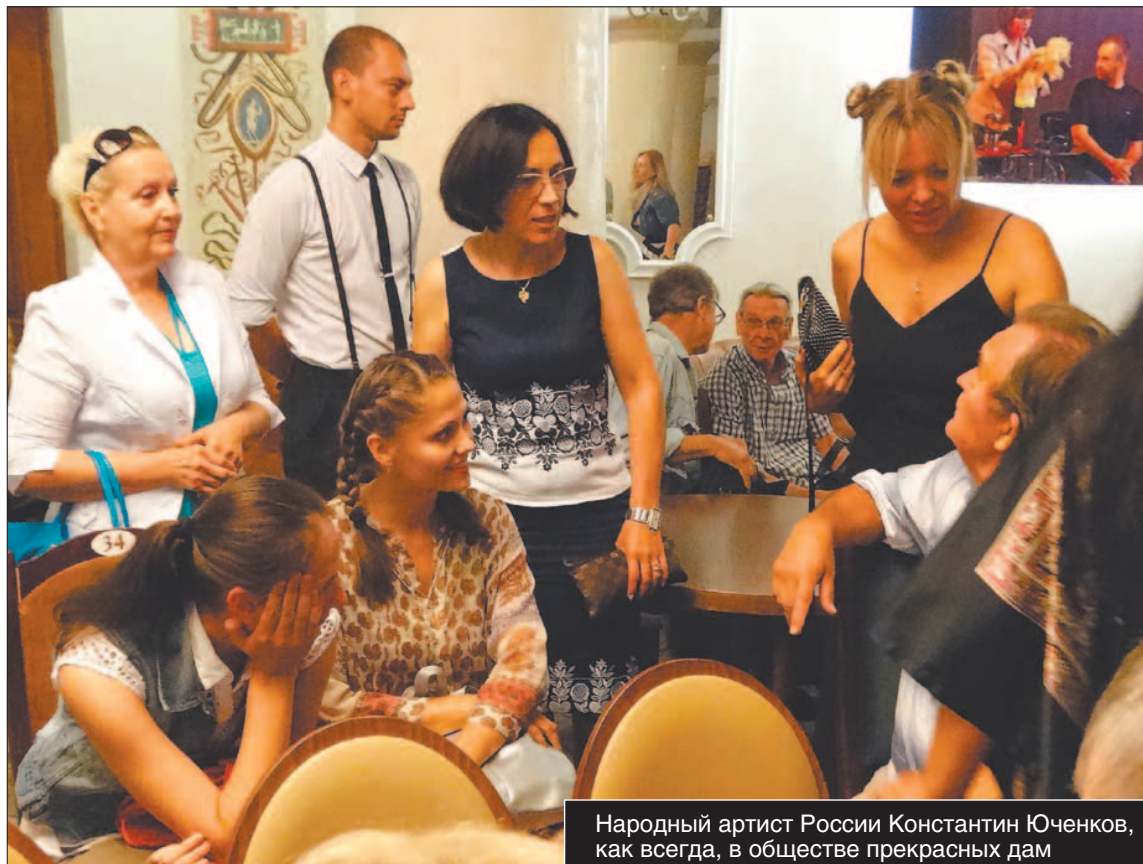
Народный артист России Константин Юченков, как всегда, в обществе прекрасных дам

Александра Павлишина. Спектакль будет сопровождаться исполнением живой музыки, анимацией послевоенного времени, поздравлениями от труппы, а также еще невиданным в твер-