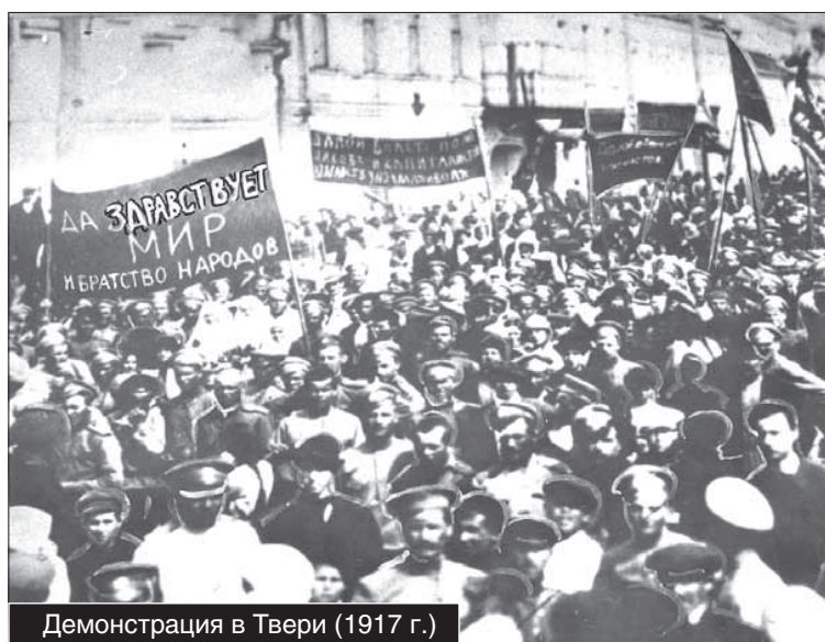
Демонстрация в Твери (1917 г.)

Ежедневная «Тверская мысль» публикует забавные заметки о ходе предвыборной агитации. В статье «Выборные силуэты» автор Гаспериус отмечает следующее: «Сонная Тверь оживилась. По улицам бегают граждане от девяти лет и выше, вымазанные клеем, но сияющими взорами. Вот оно истинное счастье – молодость и свобода! Каких-нибудь полгода назад кукиш в кармане показывали гороховому с опаской, и то преимущественно в безлунную ночь, а теперь могу водрузить полутороаршинный плакат