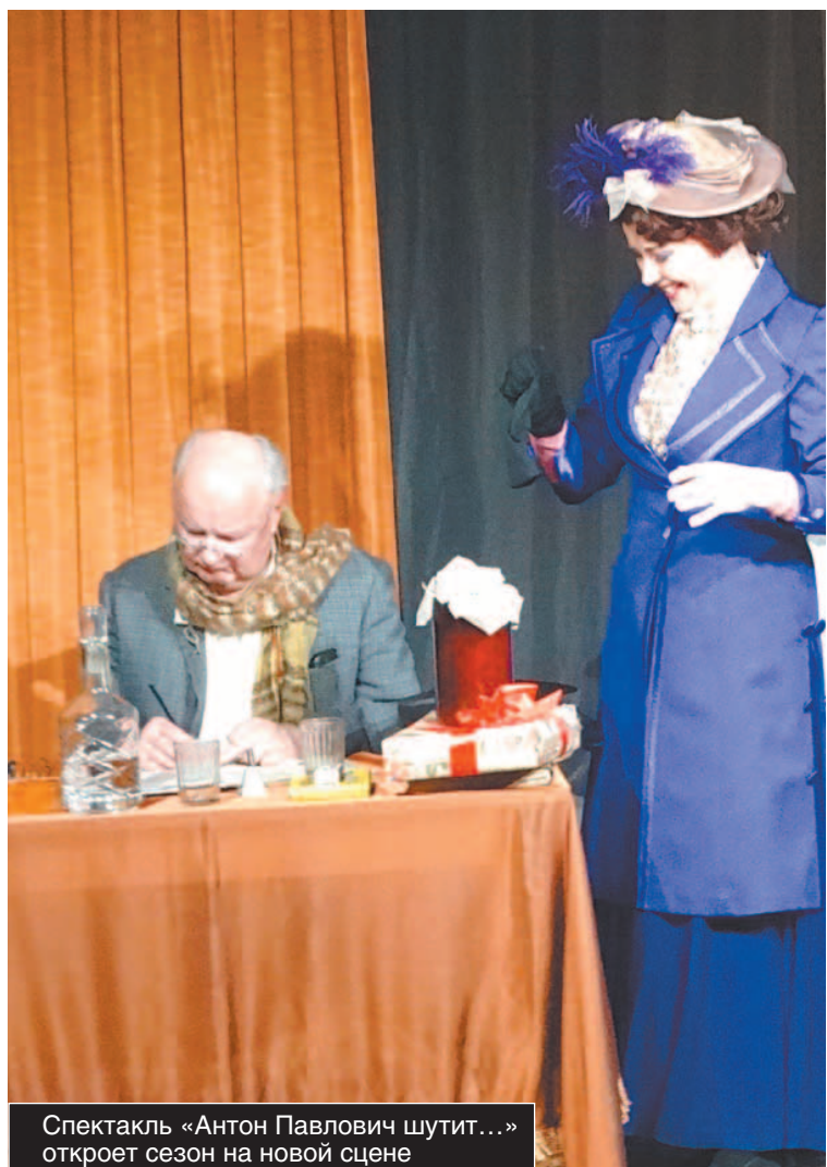
Спектакль «Антон Павлович шутит...» откроет сезон на новой сцене