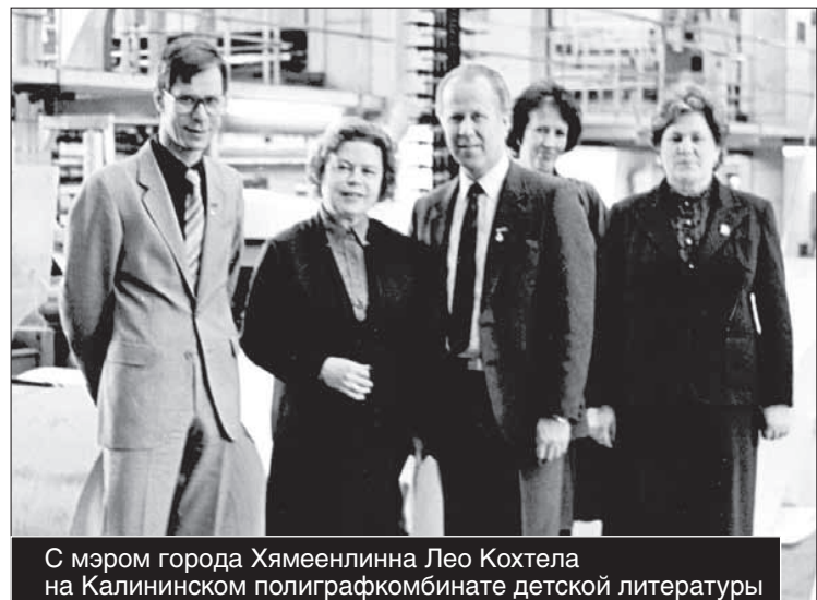
С мэром города Хямеэнлинна Лео Кохтеля на Калининском полиграфкомбинате детской литературы

Многие жители нашего города знают, что у Твери есть побратимы в разных странах: Оснабрюк в Германии, Безансон во Франции, Бергамо в Италии. Удивительно, но и здесь не обошлось без Лидии Строгановой,