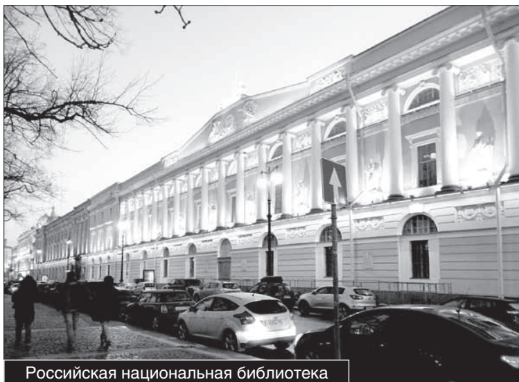
Российская национальная библиотека

Михаил Евграфович Салтыков-Щедрин — писатель, издатель, государственный и общественный деятель. Именно его имя Российская национальная библиотека носила с 1932 по 1992 годы. В то