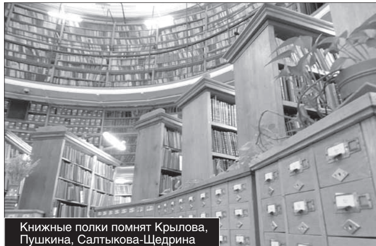
Книжные полки помнят Крылова, Пушкина, Салтыкова-Щедрина

Как видите, не только быстрый поезд «Сапсан» связывает Тверь и город на Неве.