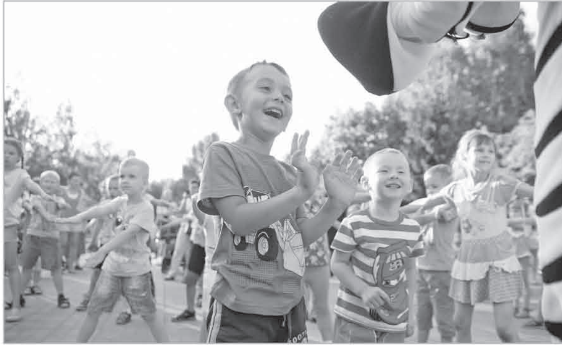
Во время летних каникул детям обеспечат интересный и разноплановый отдых, безопасность и возможность укрепить здоровье

Если ребенок предоставлен сам себе и имеет массу свободного времени, он будет искать, чем заняться. И обязательно найдет, только не всегда это будет безопасно для его здоровья или полезно для развития. Так что взрослые с началом каникул, до которых осталось чуть больше месяца, радуются освобождению от необходимости проверять домашние задания, но при этом думают, как организовать своему чаду досуг. Хорошо бы еще и его здоровье укрепить за лето. А некоторые подростки мечтают о самосто-