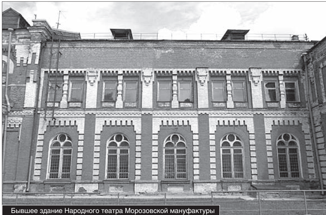
Бывшее здание Народного театра Морозовской мануфактуры