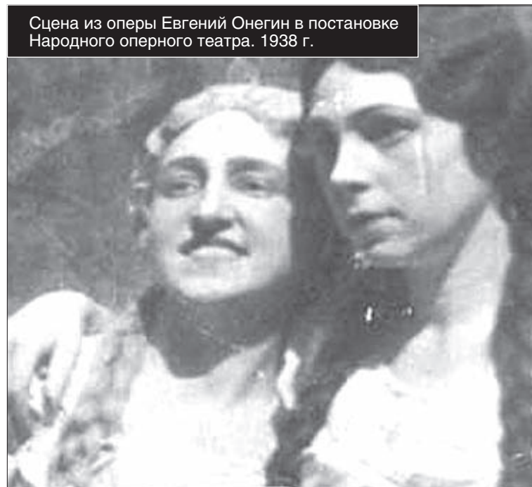
Сцена из оперы Евгений Онегин в постановке Народного оперного театра. 1938 г.

В 1923 г. был создан Главрепертком (Главный комитет по репертуару, или ГРК). Он очень строго подходил к подбору репертуара. В ГАТО сохранились документы Тверского губернского отдела народного образования – циркуляры Главлита (Главное управление по делам литературы и издательств) 1925 года с грифом «секретно». В одном из таких документов записано: «В разъяснение циркуляра № 216/с в виду наблюдающихся случаев неправильного толкования его на местах, ГРК сообщает: 1. Без разре-