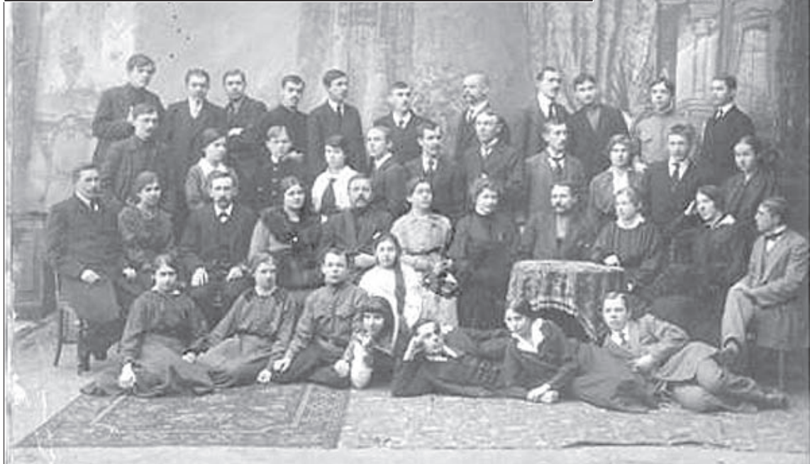
Труппа Народного театра Морозовской мануфактуры 1917-1918 гг.

атра ставились профессиональные оперы, концерты, литературно-музыкальные вечера.