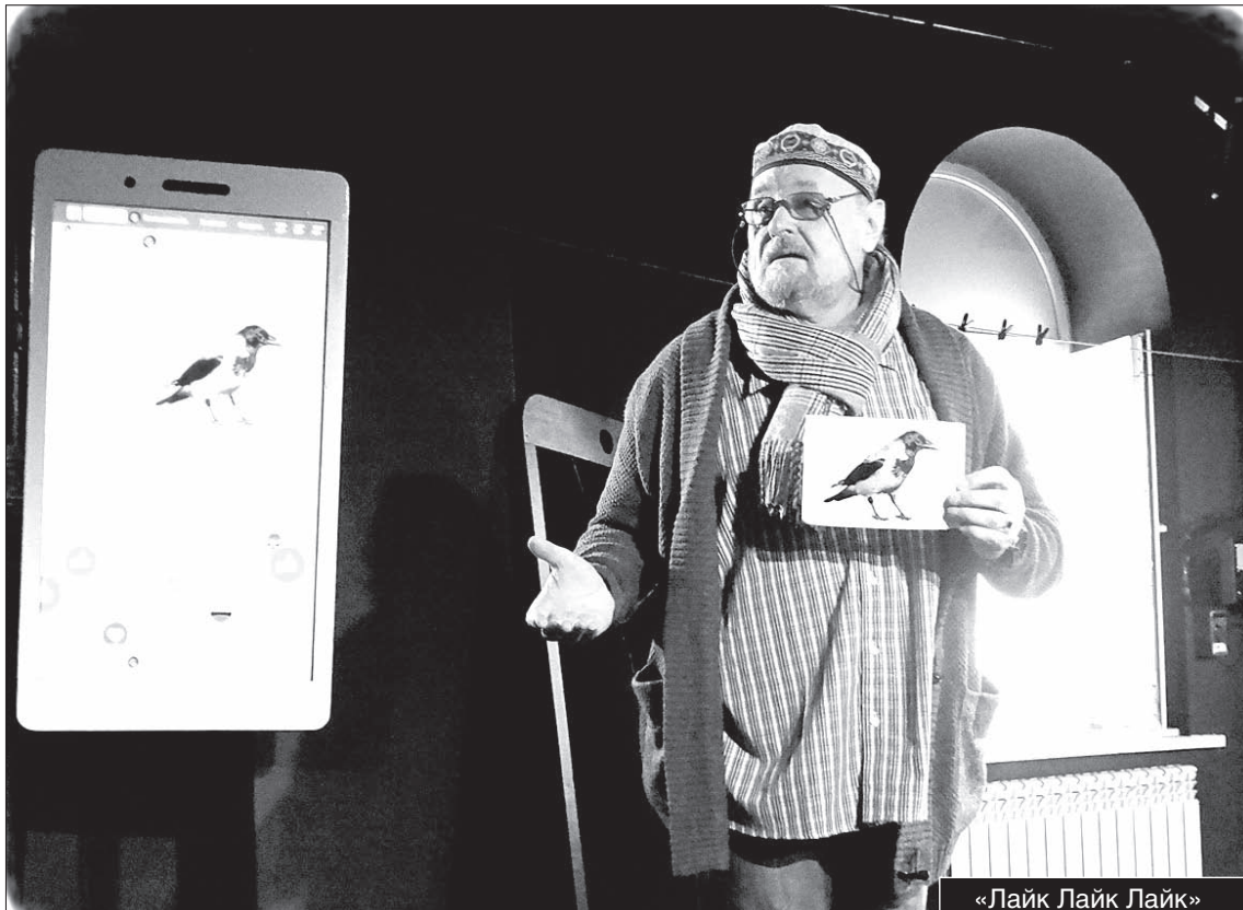
«Лайк Лайк Лайк»

Тверским поклонникам театра жаловаться на скуку не приходится. В Твери действуют три профессиональных театра: драмы, юного зрителя и кукольный. Последний, впрочем, в последнее время сосредоточился на постановках для детской аудитории. Это не всё: в Тверь приезжают с гастролями театры других регионов, случаются антрепризные спектакли, фестивали любительских театров и театров малых городов, иные события в культурной жизни — например, почти каждый выходной что-то любопытное (и при том бесплатное) происходит в областной библиотеке имени А.М. Горького. Нельзя не упомянуть концерты и постановки в