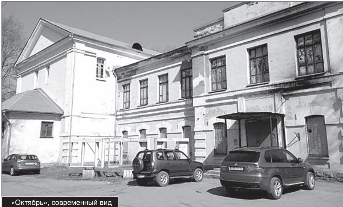
«Октябрь», современный вид