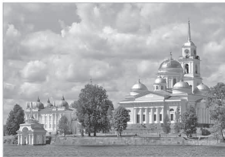
Область готовится к торжествам, паломникам обеспечат бесплатное проживание и питание

По номеру «горячей линии» паломнического центра 8-800-350-28-90 (звонок бесплатный) можно получить информацию об участии в праздничных мероприятиях. «Горячая линия» работает с 08.00 до 20.00, ежедневно.