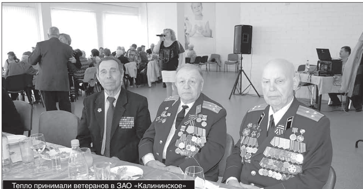
Тепло принимали ветеранов в ЗАО «Калининское»

шины, чтобы они проехали по главной улице с оркестром... И тем не менее те, кто может идти, идут, несмотря ни на что. Когда я предлагаю пересесть в автомашину, отвечают: «Мы пол-Европы прошли, проползли, что для нас эта дорога к Обелиску! Надо идти...»