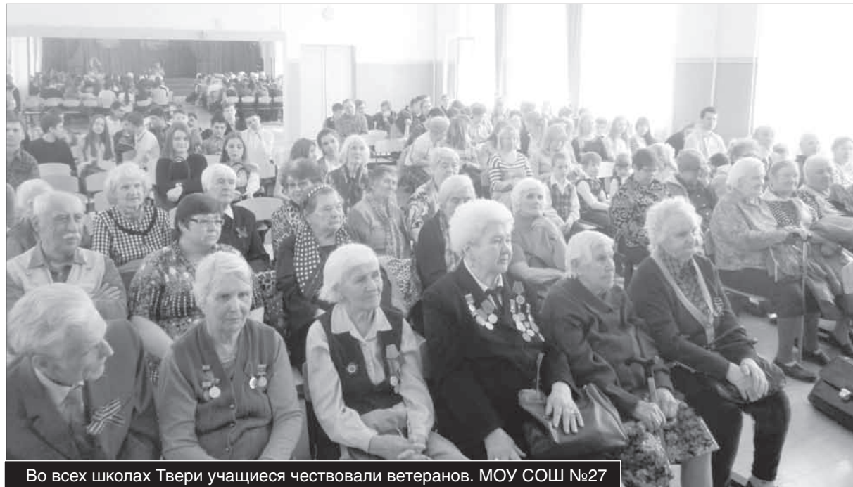
Во всех школах Твери учащиеся чествовали ветеранов. МОУ СОШ №27

Думаю, пропагандисты таких идей и сами не ведают, что творят. Сомневаемся — приходите, поговорите с ветеранами, этими солидными стариками — открыто, без обиняков... А пока напомним всем, кто чего-то не понял.. Всем, что у нас сегодня есть, мы обязаны на-