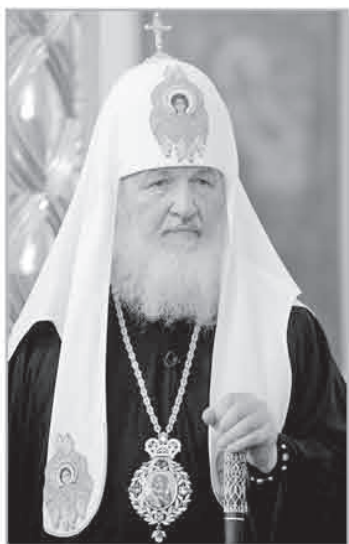
Патриарх Кирилл совершит божественную литургию, крестный ход и молебен в обители

Паломнический лагерь возле монастыря будет работать с 8 по 12 июня. На берегу озера Селигер организуют бесплатное